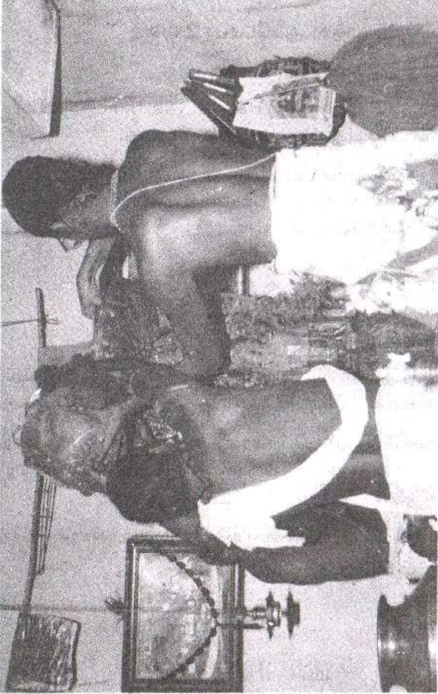
புரீ பூனிவாசப் பெருமாள் அவதார தினத்தன்று (அக்டோபர் 3), பெருமாளுக்கு 'ஸஹஸ்ர தாரை'யால் திருமஞ்சனம் செய்யப்படும் நிகழ்ச்சி.