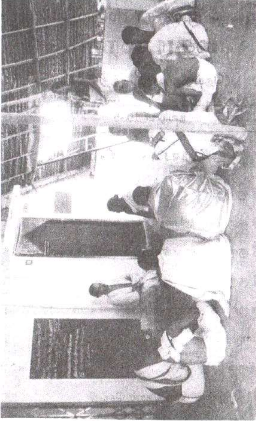
ஆந்திர தேசத்திலிருந்து வந்திருந்த வேத பண்டிதர்களின் வேத பாராயணத்தை ஸ்ரீ குருஜி சீரவணம் செய்யும் காட்சி